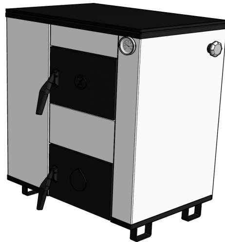
Rys. 2 OGRZEWACZ OGNIWO 12 kW