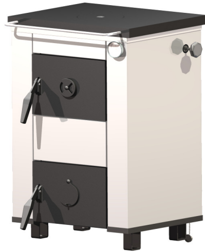
Rys. 1 OGRZEWACZ OGNIWO 7kW