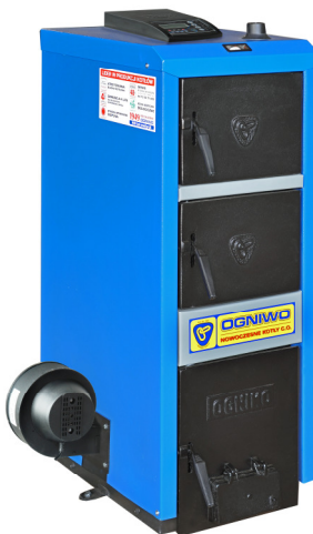
Kocioł S6WC Classic z zespołem napowietrzania (zespół napowietrzania nie wchodzi w zakres dostawy kotła)