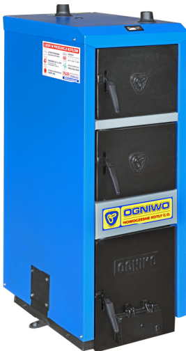
Kocioł S6WC Classic